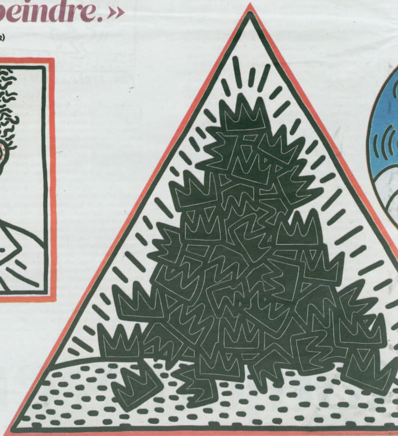
A Pile of Crowns for Jean-Michel Basquiat, 1988.