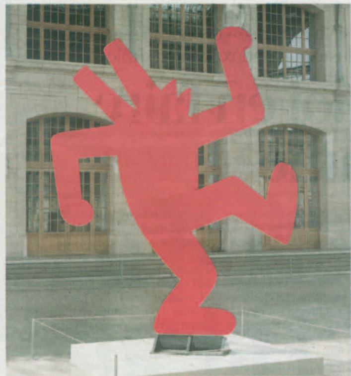
Untitled (Red Dog #2), visible au CentQuatre. MARC DOMAGE