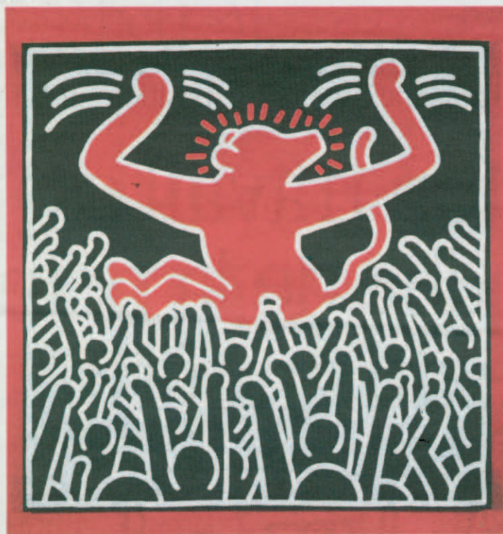
Untitled, 9 avril 1985.