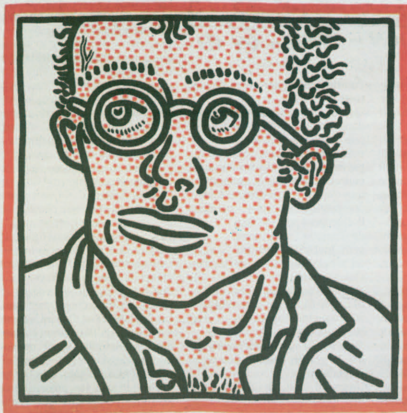
Untitled (Self-Portrait), 2 février 1985.

Keith Haring, 25 juin 1986, Journal (Flammarion, 2012)