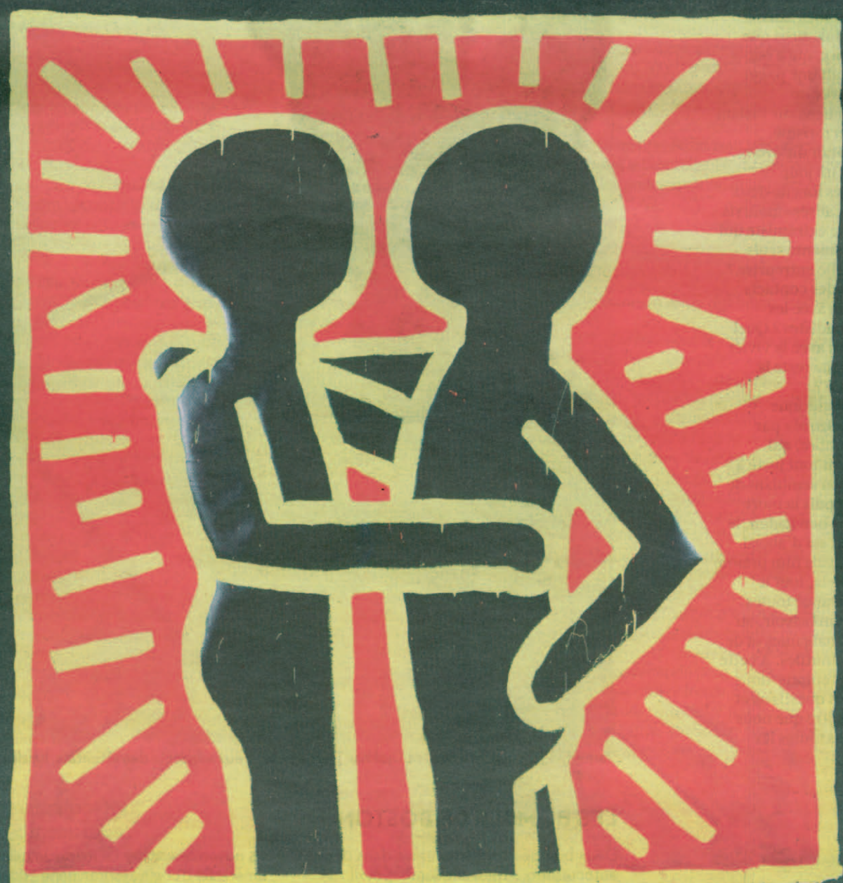
Keith Haring, Untitled , 1982. COLL. PARTICULIÈRE KEITH HARING FOUNDATION

LE PEINTRE NEW-YORKAIS CÉLÈBRE À PARIS PAR DEUX EXPOS, PAGES 22-25