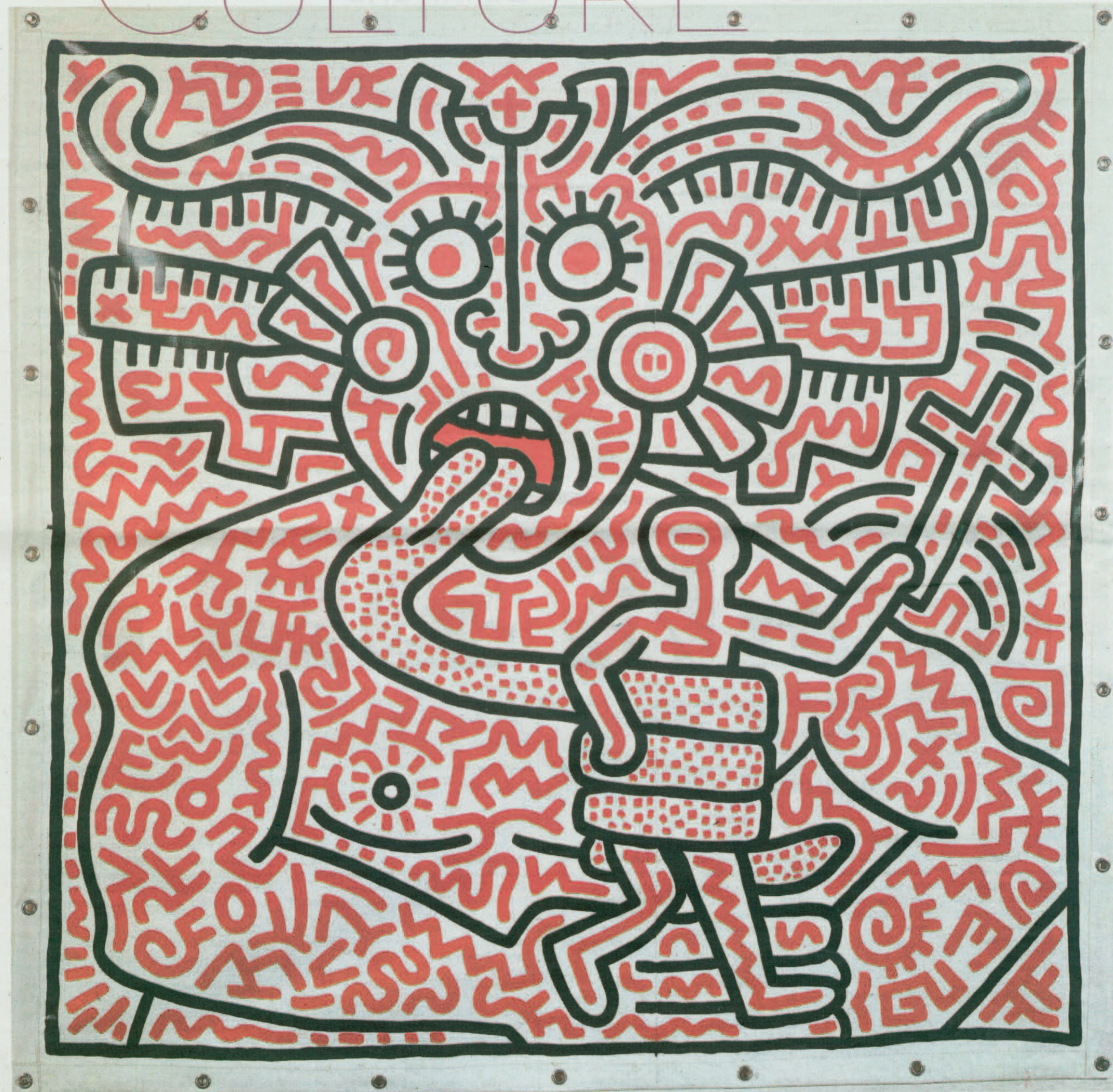
Untitled, 25 août 1983.