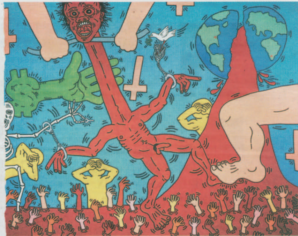
USA for Africa, 1985.